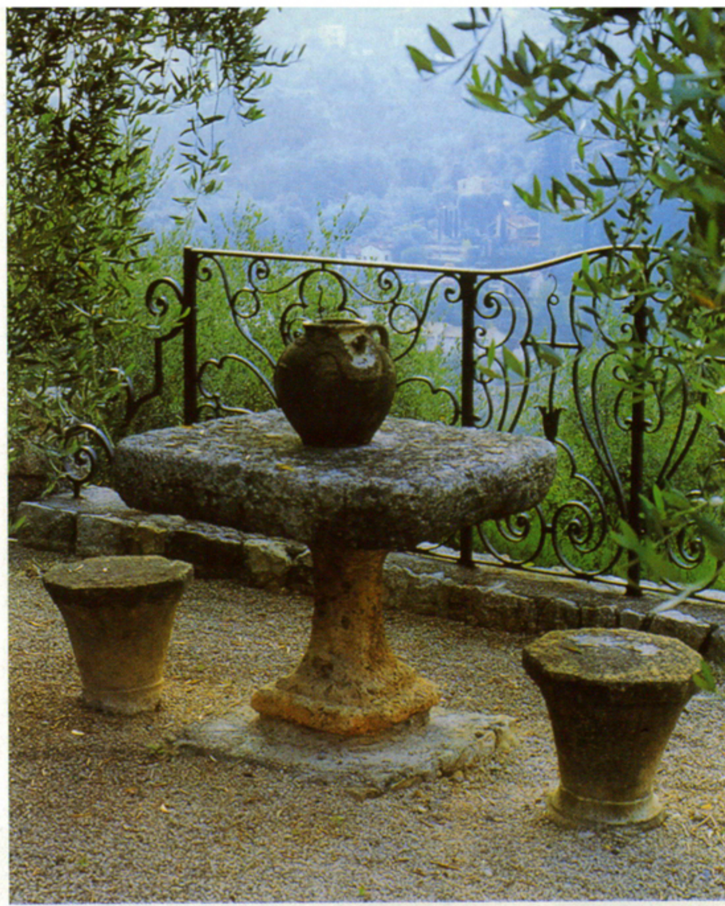
A kőbútorokat hamar befogadja a kert, s az idő előrehaladtával egyre szebbé és nemesebbé válnak