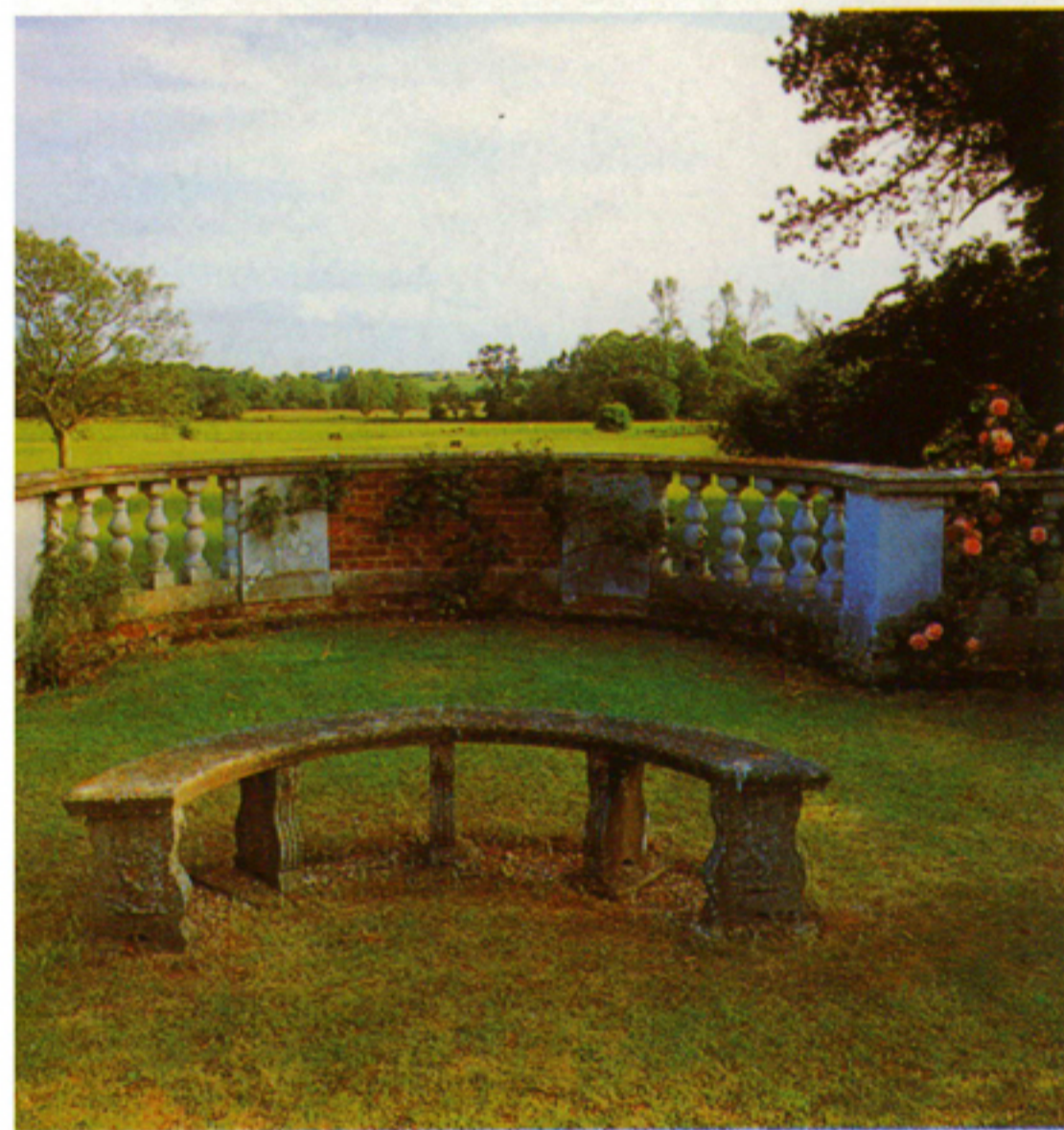
Az egyszerű kőpad a mögötte lévő balusztrád formáját ismétli meg

milyen funkciót szánunk. A szentimentális parkok kanyargó ösvényein meghatározott érzetek kiváltása volt a cél. A múromok, állsírok és emlékhelyek mellett mindig padokat is találunk, ahol a szentenciózus feliratokat olvasó látogató az élet múlásáról elmélkedhetett vagy esetleg a magány édesbús érzésének adta át magát. A nagyobb eltévelyítő utak, labirintusok fordulóján szintén padok álltak, melyeket a megfáradt tévelygők számára, erőgyűjtés céljából létesítettek. A barokk és reneszánsz kerti bútorokat enyegésre, szerelmi játékokra létrehozott félig nyitott, félig zárt intim búvóhelyeken találjuk. A kúszónövényekkel befuttatott és ülőalkalmatosságokkal ellátott pavilonok és rózsalugasok a kertben sétáló párocskák számára felettébb hivatogóak lehettek. Ebben a korban a tájba expandáló kertrészeket a sugaras tengelyek végén elhelyezett kőpadokról a te-