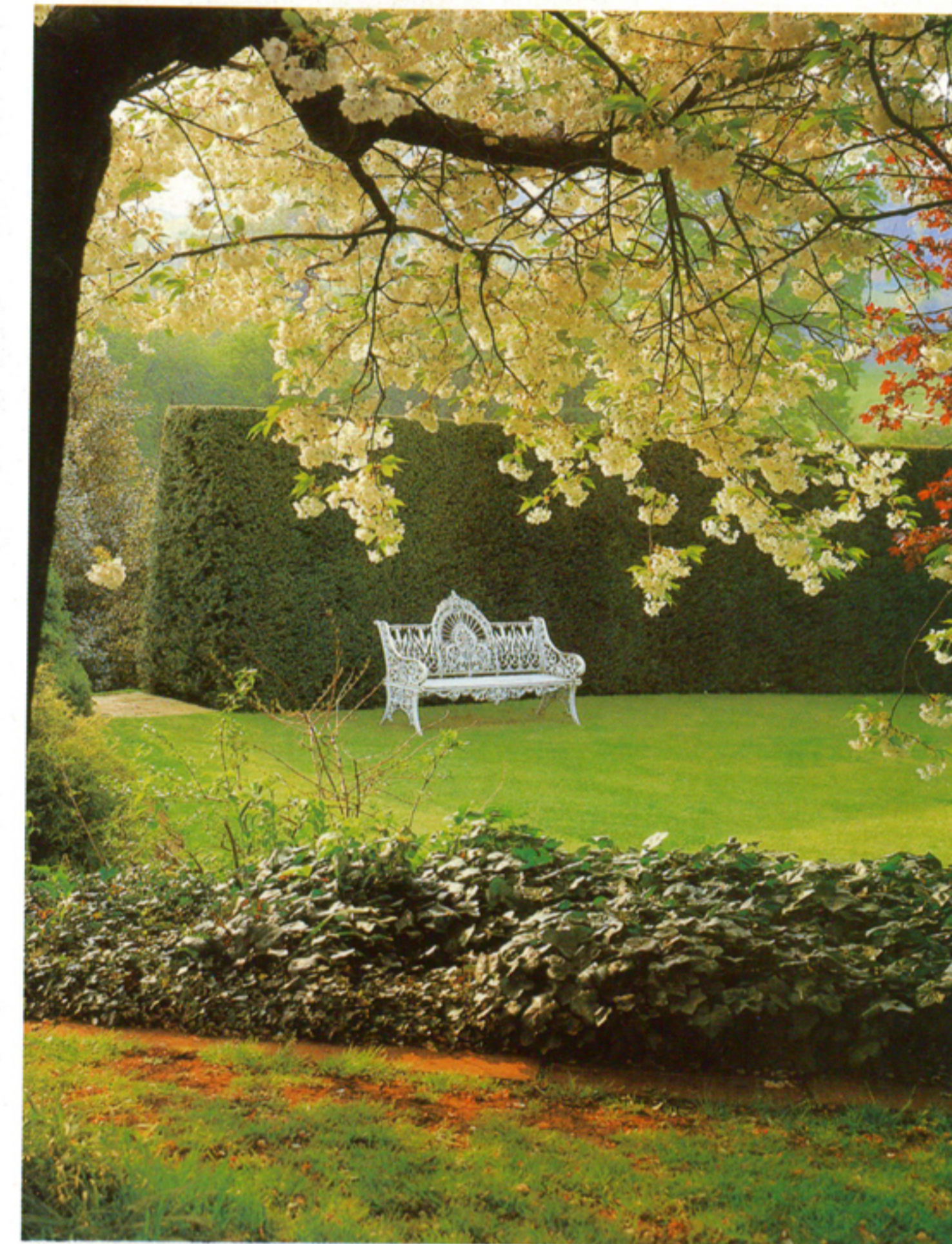
A Viktória korabeli fehér, öntöttvas pad imponáns látványt nyújt a nyírt növényfal előtt