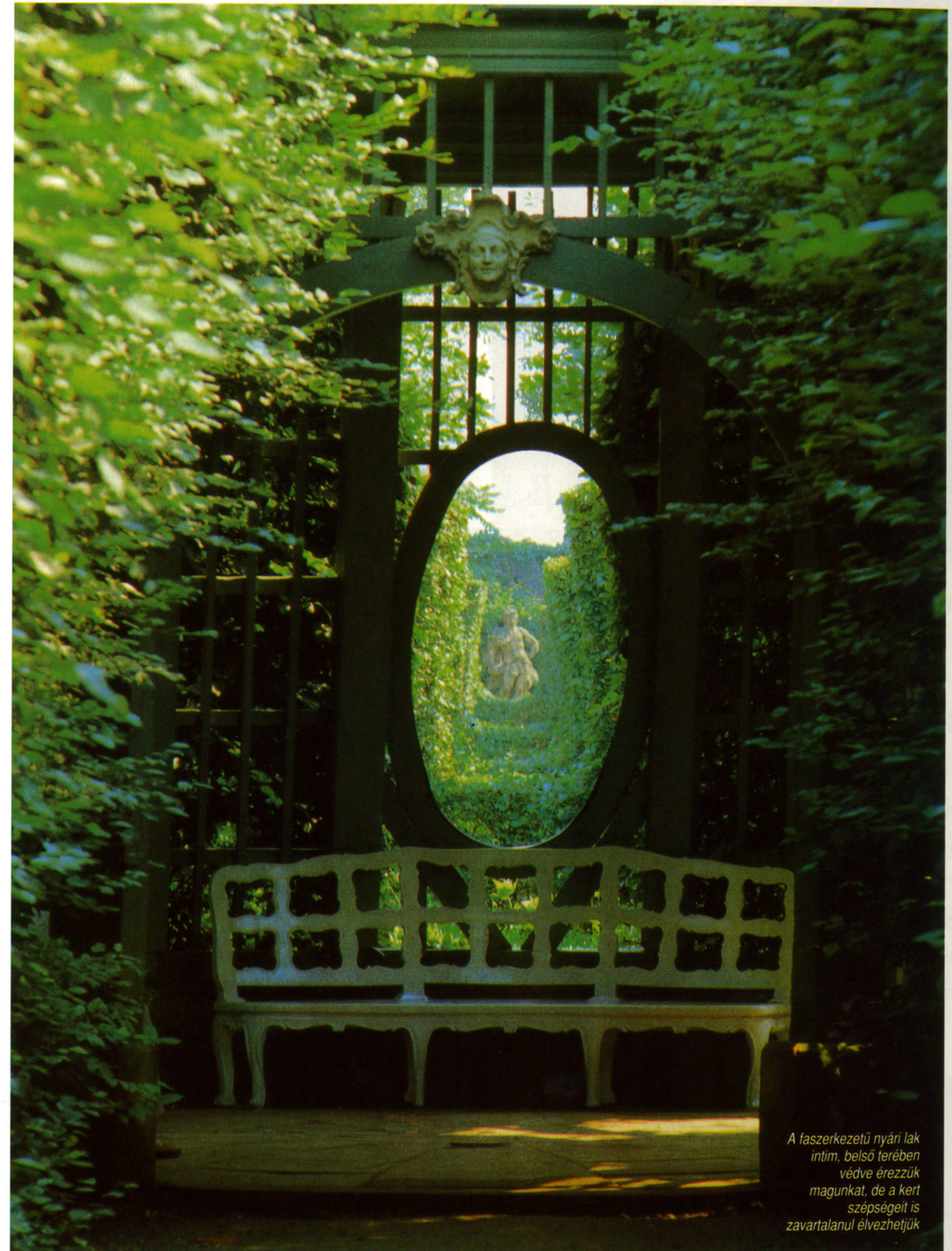
A faszerezetű nyári lak intim, belső térben védve érezzük magunkat, de a kert szépségeit is zavartalanul élvezhetjük