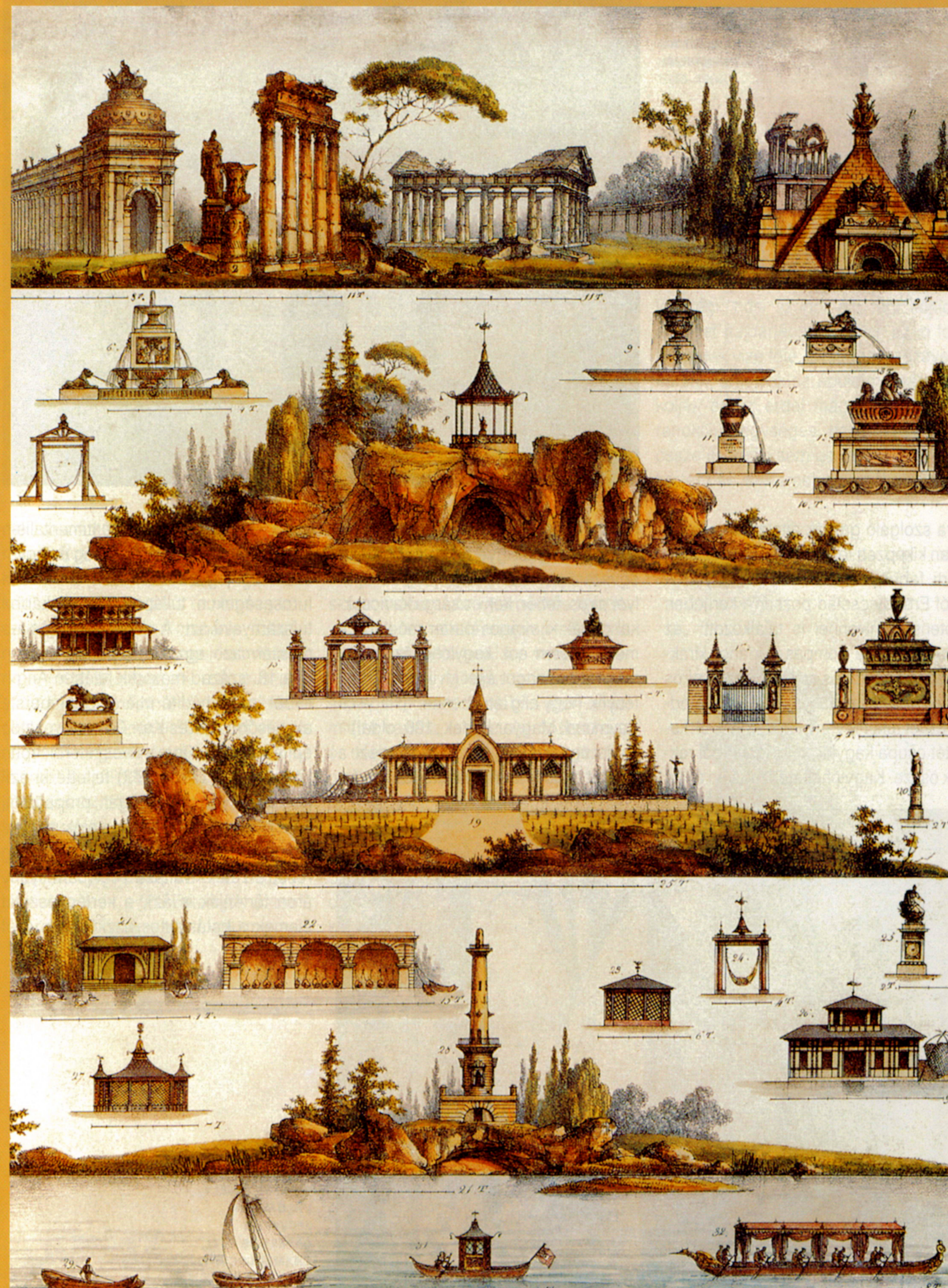
KERTI ÉPÍTMÉNYEK C. MOTTE SZÍNES LITOGRFÁIJA, 1820

Nem kevésbé bizarr a barokk kert másik etalon építménye, a műbarlang vagy más néven grotta. A hűtözés cél-