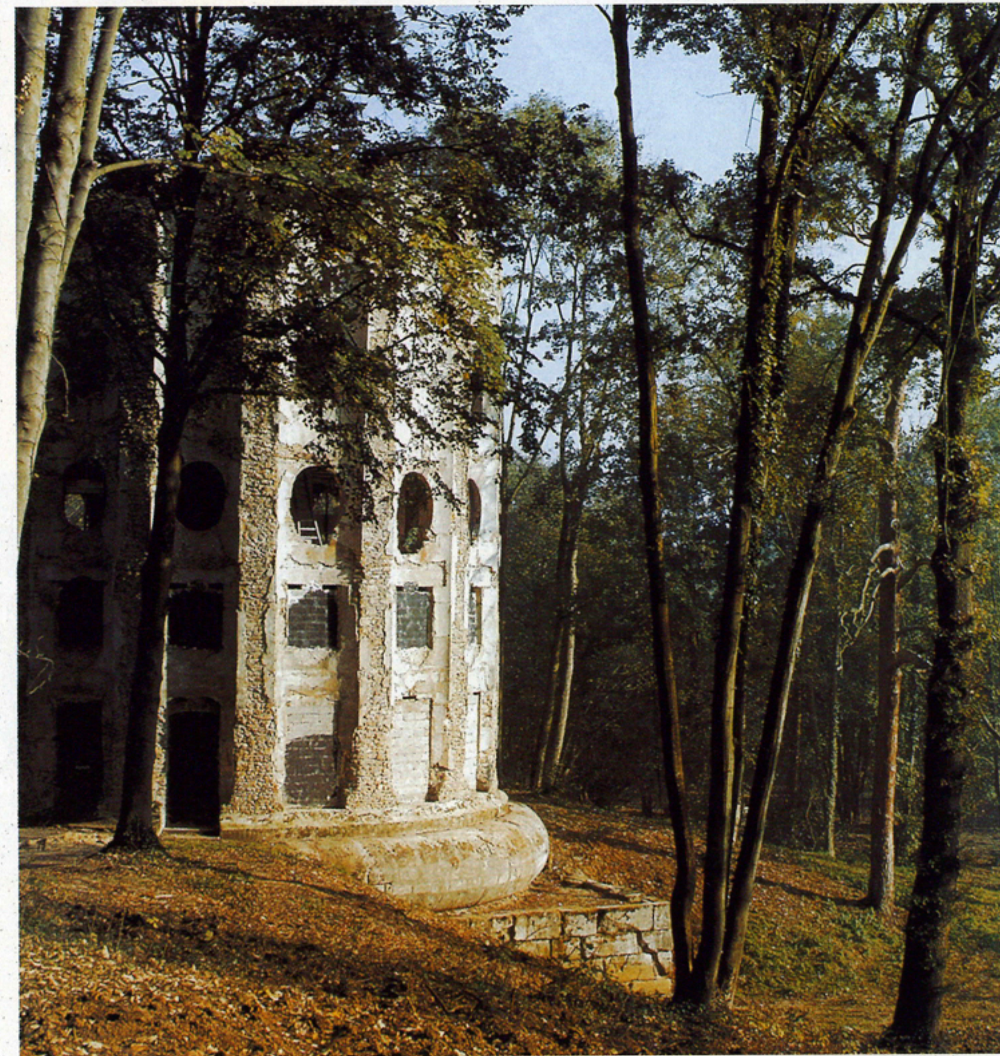
ANTIK OSZLOPOT UTÁNZÓ ÉPÜLET, DÉSERT DE RETZ