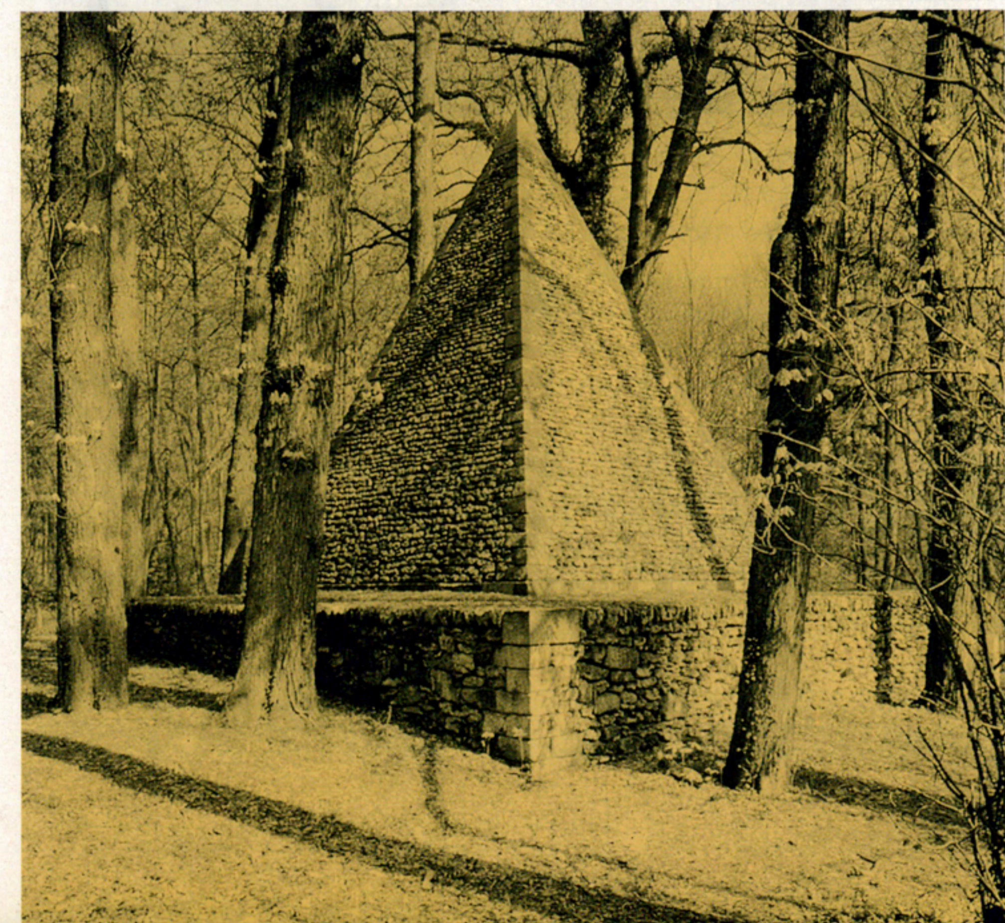
PIRAMIS, AMELY VALÓJÁBAN JÉGVEREM DESERT DE RETZ, CHAMBOURCY

kozni, tévedünk, mert a szentimentalista kerteknek a természetesség és egyszerűség jegyében sikerült a barokk furcsaságokon túllépni, vagy inkább túlszárnyalni azt. A világ négy égtájáról származó, egzotikus épületek divatja a 18. század második felében Angliából indult hódító útjára. Chambers, aki később a híres Kew Garden vezető építészé lett, Kína művészetéről írott könyveiben (1752–1772) fejtette ki az angolkert változatosságát propagáló és a gyakorlatban meg is valósuló nézeteit. Mivel az angolkertben meghatározott érzetek kiváltása a cél (bármilyen áron történjék is az), a kertépítészeti elemek a hatáskeltés eszközeivé vál-