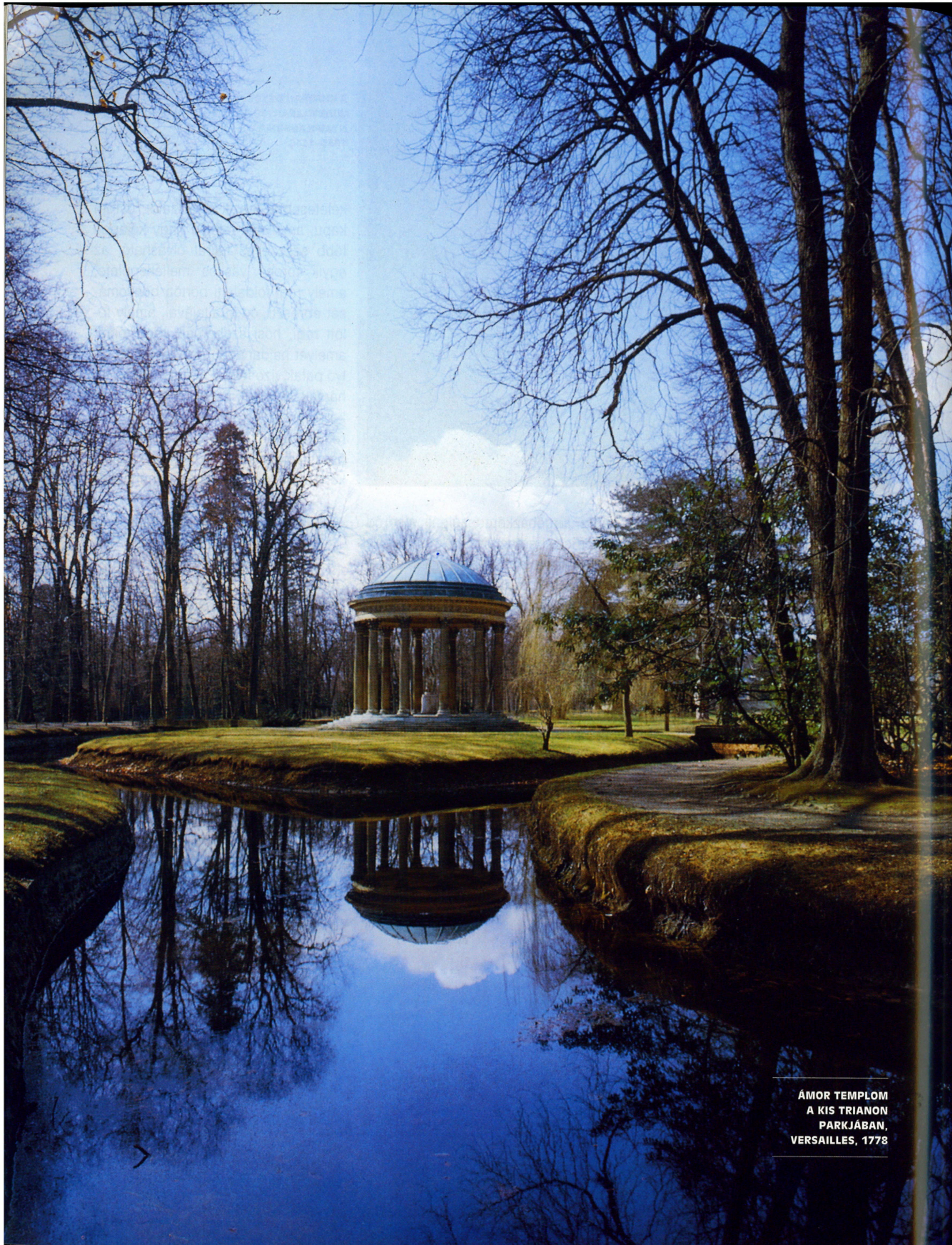
ÁMOR TEMPLOM A KIS TRIANON PARKJÁBAN, VERSAILLES, 1778