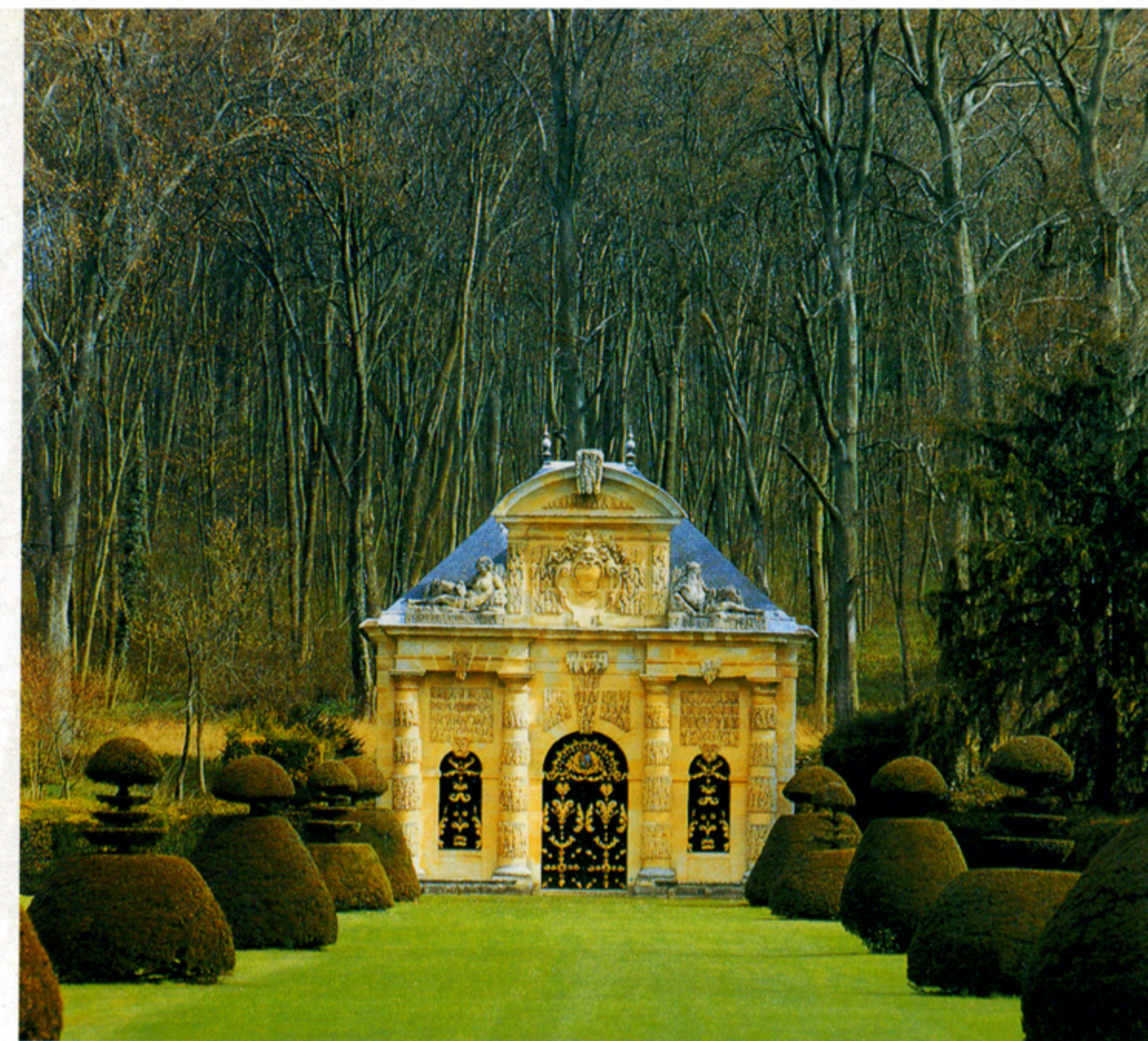
A CHÂTEAU DE WIDEVILLE NYMPHANEUMA 1635–1640

kéletesebbé teszik a látszatot; ősrégi kapu, amelynek tetején nagy kőlapon több száz éves felirat olvasható; az egyik torony vaskos melléképülete, amely régi földalatti börtön benyomását ébreszti, ódon aijtájával, amely fölött régi, hősi szobor áll; régi kőhíd, amelyet hajdanában emeltek az itt folyó patak vize fölé; a magas, százéves hársak, amelyek az épületet beárnyékolják és az erdei magány - mindez rendkívül egységes hatásban olvad össze és senki sem gondolná, hogy itt kertészlak áll, amelynek néhány éve