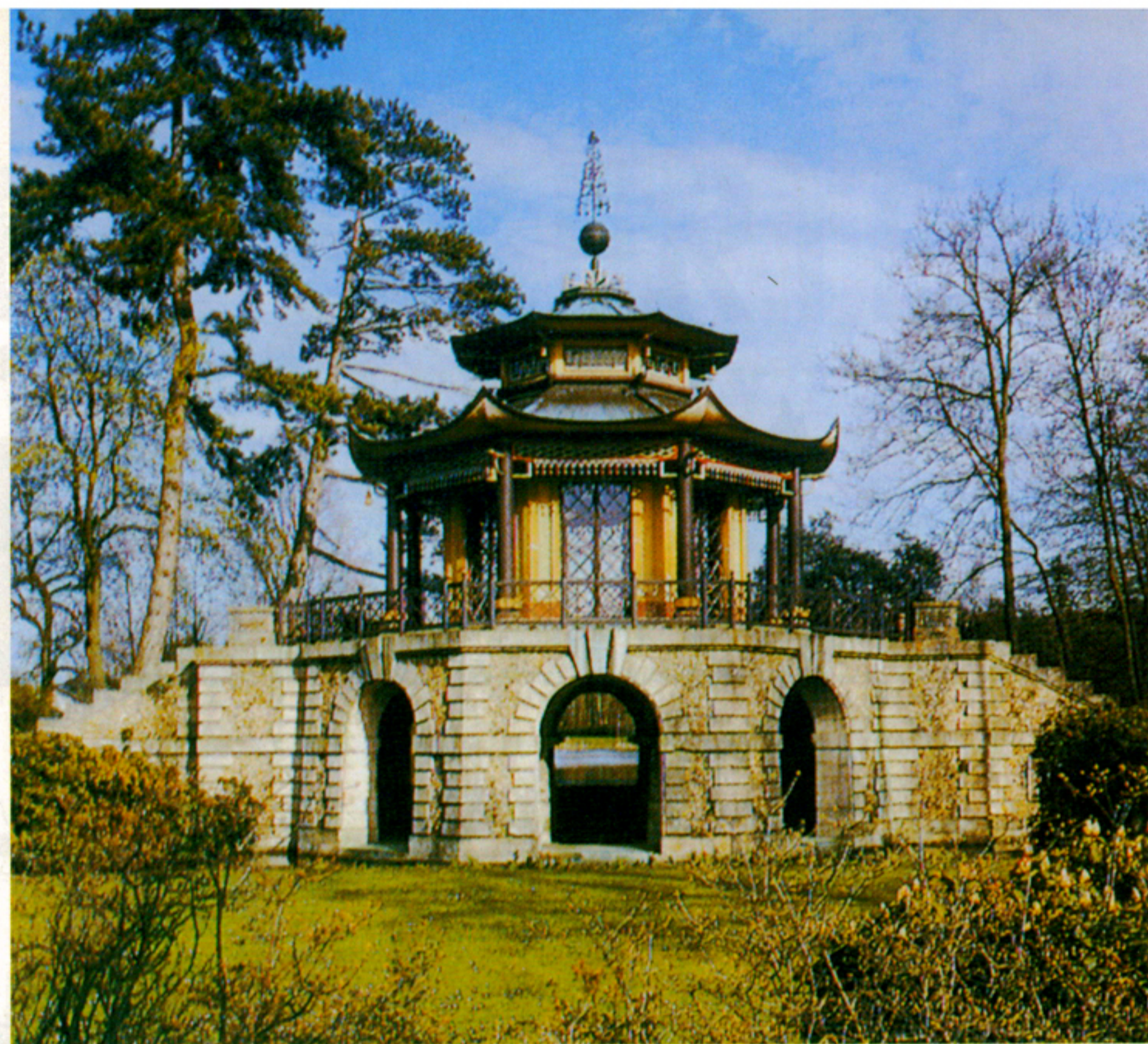
EGY 18. SZÁZADI ANGOLPARK KINAI PAVILONJA