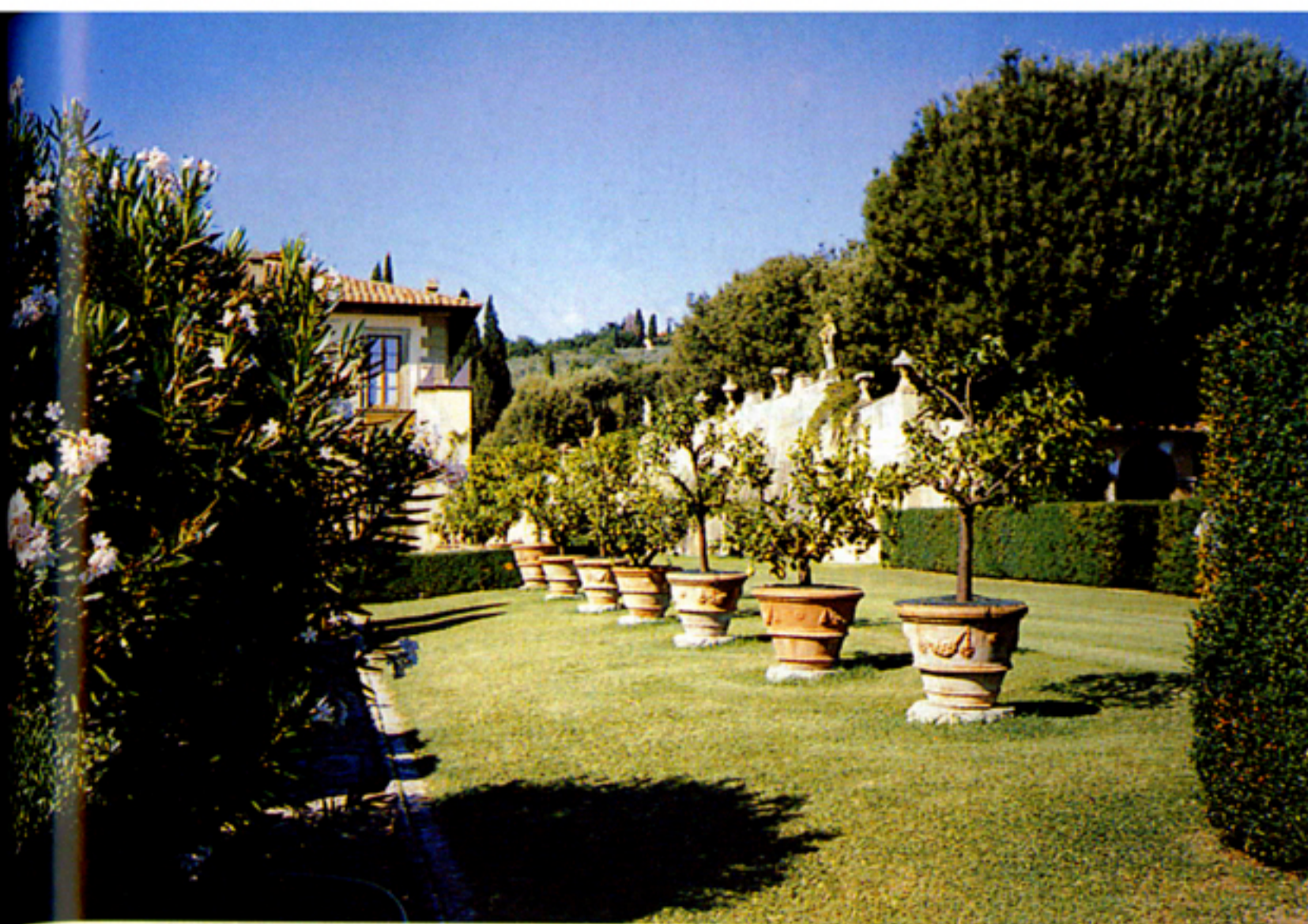
ORANGERIE A NYÍRT, SÓTÉTZÖLD NÖVÉNYFALAK ELŐTT (VILLA GAMBERAIA)