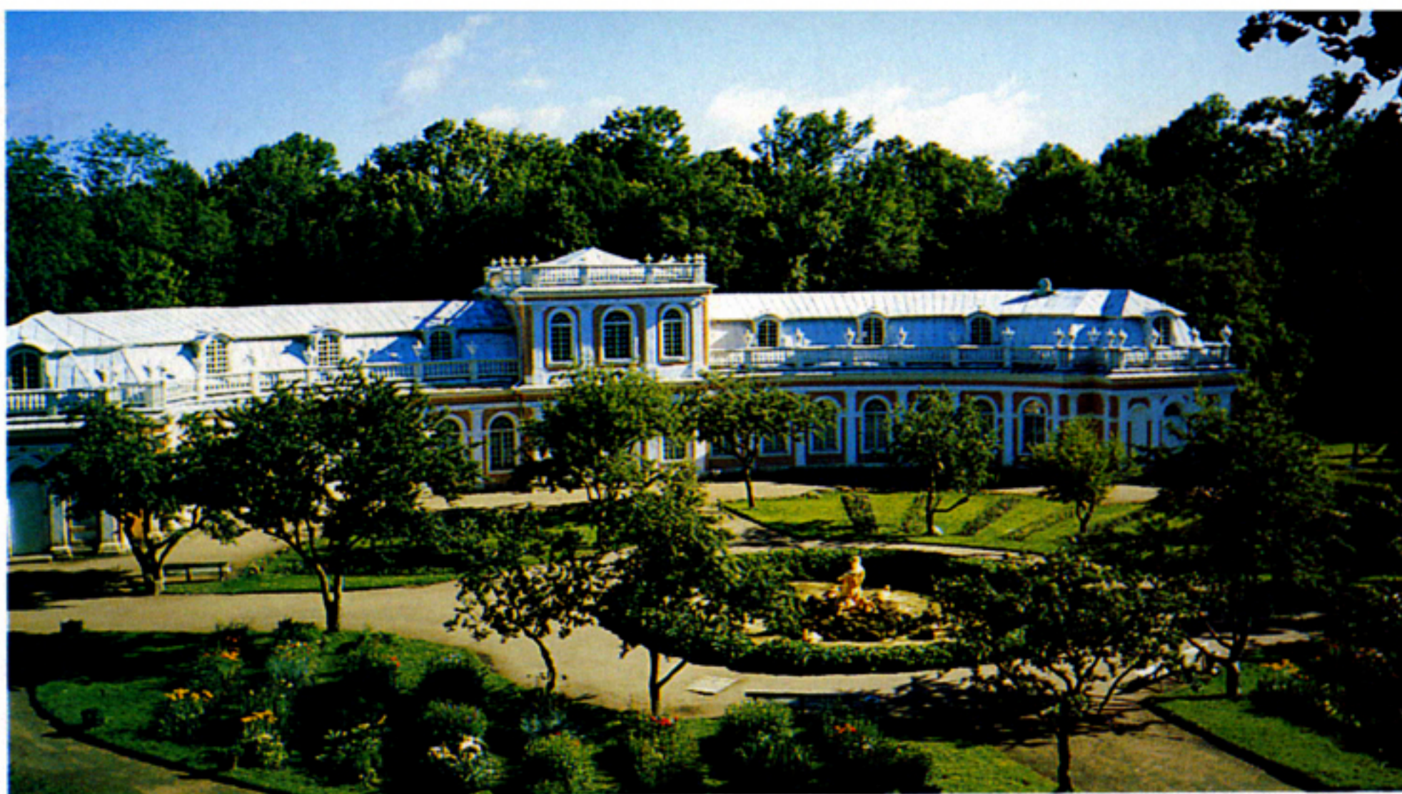
EGZOTIKUS NÖVÉNYEK SZÁMÁRA ÉPÍTETT TELELTETŐHÁZ AZ OROSZORSZÁGI PETERHOFBAN

A dézsás növényeket ma már nem kuriozitások, hanem praktikumuk és dekoratívitásuk miatt választjuk. A társadalmi kényeszeretek többé nem a narancsligetek létesítése felé hatnak, és reprezentálni sem a kertünkkel akarunk. De zsgorodó kertjeink közepette a dézsás növényekre egy-