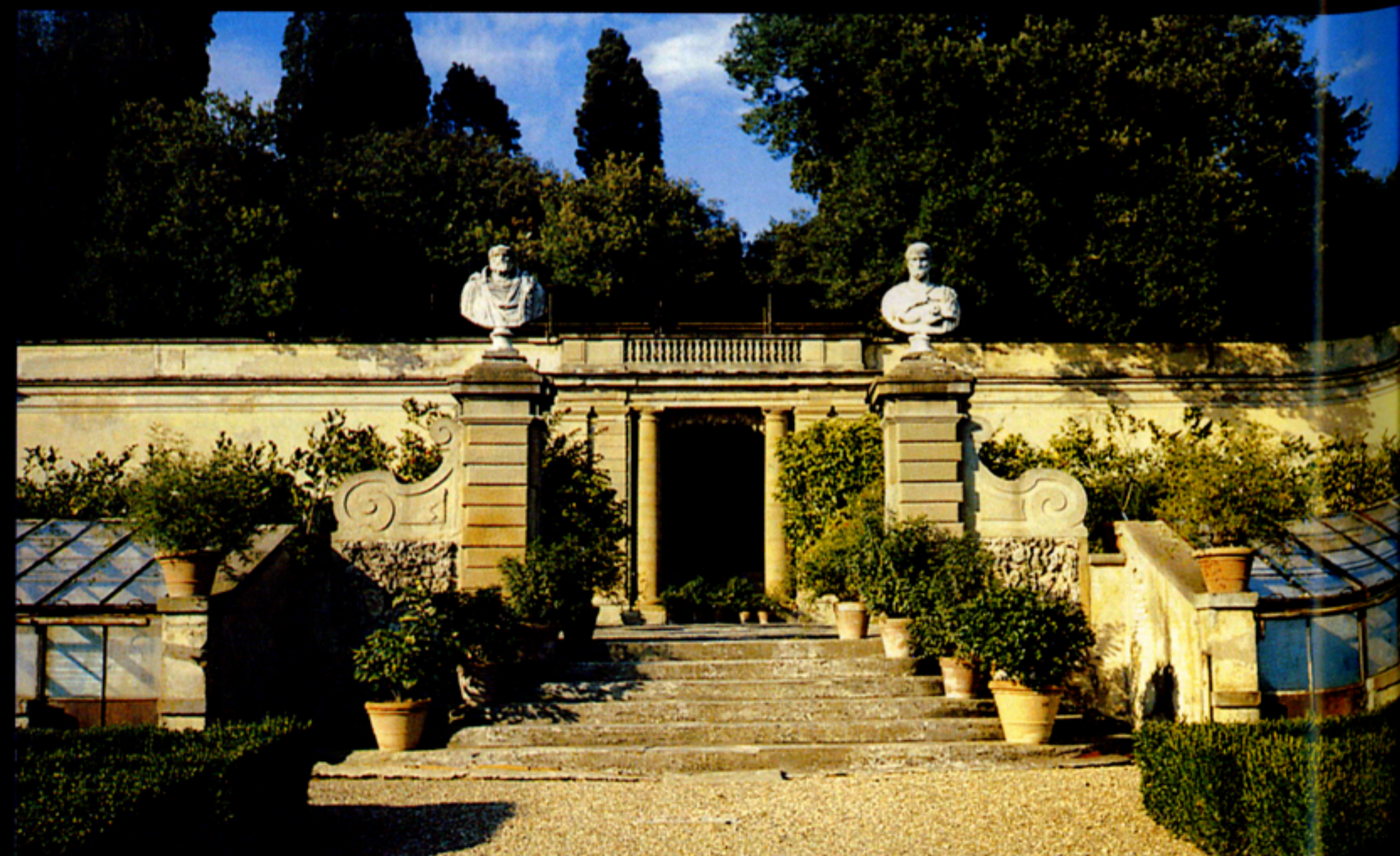
A LÉPCSŐ KÉT OLDALÁN AZOK AZ ÜVEGBŐL ÉPÍTETT HIDEGHÁZAK LÁTHATÓK, AMELYEK A NARANCSFÁK ÁTTELELTETÉSÉT SZOLGÁLTÁK (VILLA MEDICI DI CASTELLO)

a teljes 1997-es kollekció ITT stella giardin Budapest VI. ker. Lázár u. Tel.: 269-3030 Fax: 269-3030 Eger 3300 Vécsey-völgy 1 T.: (36) 313-452 F.: (36) 321-521