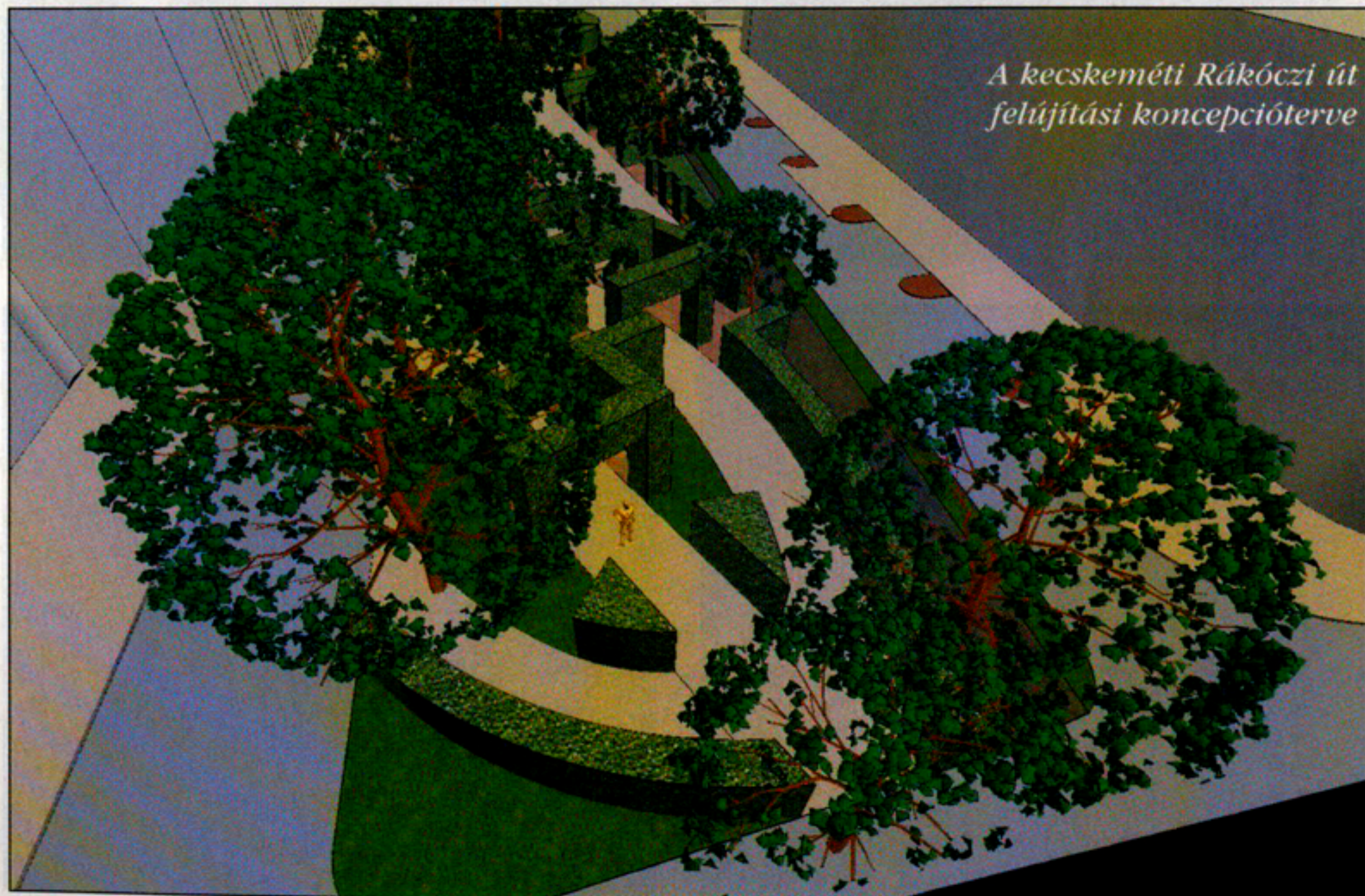
A kecskeméti Rákóczi út felújítási koncepcióterve