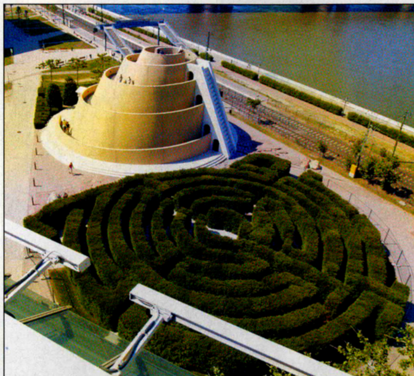
▲ Ósi emberi vágy, hogy felmenjünk a magasba, és onnan nézzünk szét. A Nemzeti Színház kertjében épült zikkuratból ezt megtehetjük